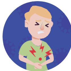
Náusea o vómito