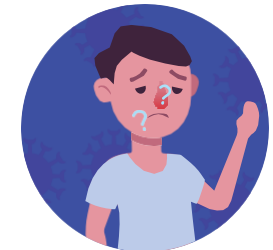
Pérdida reciente del olfato o el gusto