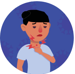
Dolor de garganta