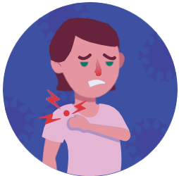
Đau cơ và mệt mỏi