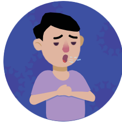
Hụt hơi hoặc khó thở