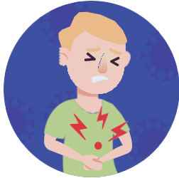
Buồn nôn hoặc nôn mửa