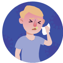
Zapušenost ili curenje iz nosa