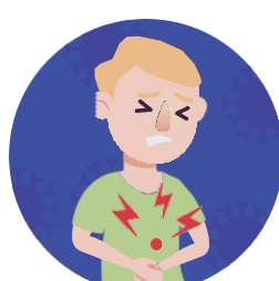
Mučnina i povraćanje