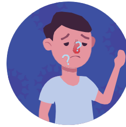
Gubitak ukusa i mirisa