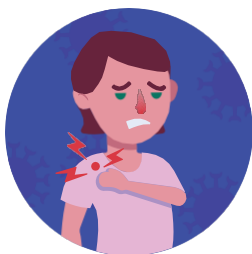
Bolovi u mišićima i umor