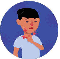
Dolor de garganta