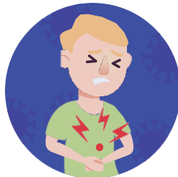
Náusea o vómito