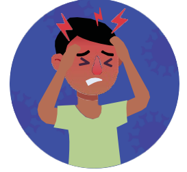
Dolor de cabeza