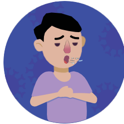
Siente que le falta el aire o dificultad para respirar