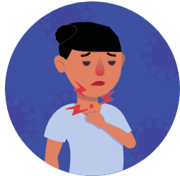
Dolor de garganta