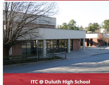
ITC @ Duluth High School