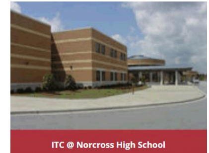
ITC @ Norcross High School