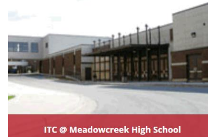
ITC @ Meadowcreek High School