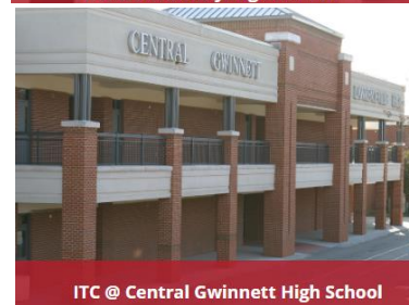
ITC @ Central Gwinnett High School